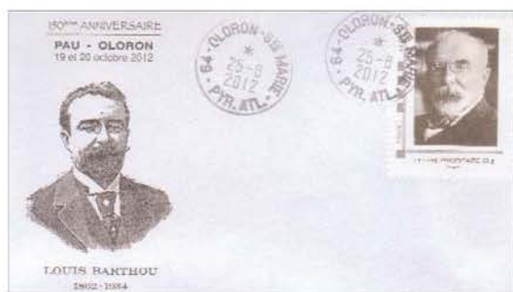
Louis BARTHOU (1862-1934)

Personnalités mises à l'honneur par le GPB en 2012