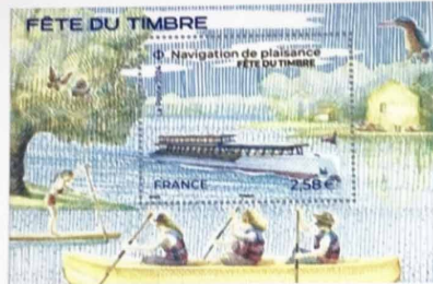
Un des deux nouveaux timbres émis par La Poste et en vente dès ce week-end lors de la Fête du timbre.