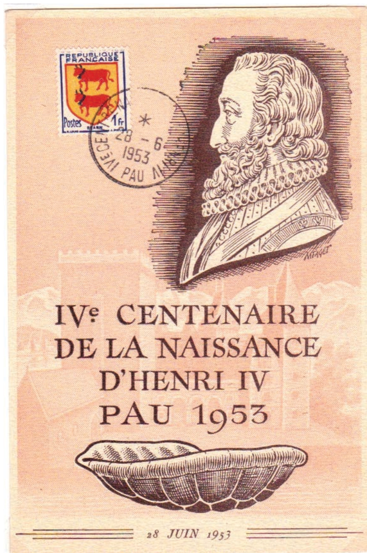
Reproduction du verso de la carte commémorative.

1953 Emission d'une carte commémorative pour le 4 ème centenaire de la naissance de Henri IV (18/06/1953)